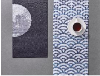
渡文株式会社（西陣織） テーブルセンター「青海波」と「月」

下記の写真をプレス用としてご用意しております。また、「DENSAN」のロゴマークもご用意しております。 プレス写真やその他のデータが必要な際は、プレス担当までお問合せください。