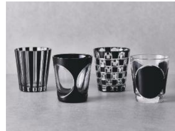
木本硝子株式会社（江戸切子） カットグラス「MOON」と「KUROCO」