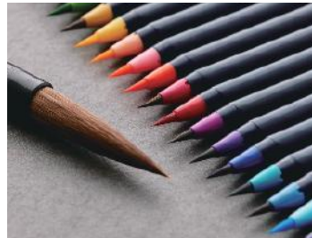
株式会社あかしや（奈良筆） 水彩毛筆「彩」