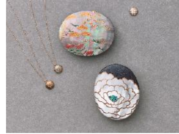
うるしアートはりや（山中漆器） 蒔絵アクセサリー「HARIYA」と「BISAI」